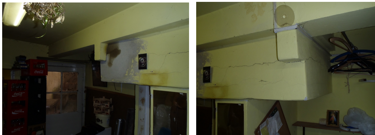
Obr. 2 Pohled na stávající dojezd výtahu v horní úrovni 1. PP