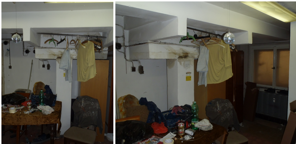
Obr. 1 Pohled na stávající dojezd výtahu v horní úrovni 1. PP