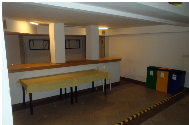
Obr. 3 Pohled na dolní úroveň 1. PP